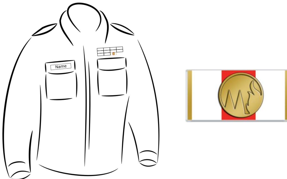
Abbildung 2: Trageweise als Bandschnalle

Alle Ehrungen werden an der dezenteren Bandschnalle dargestellt. Die Orden im Original werden dann nicht mehr getragen.